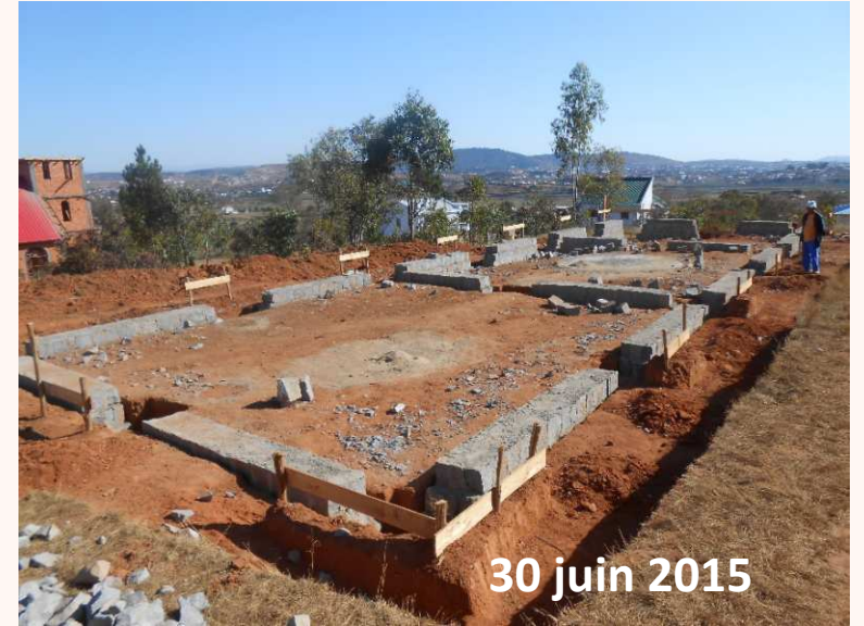
30 juin 2015