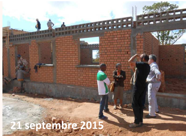
21 septembre 2015