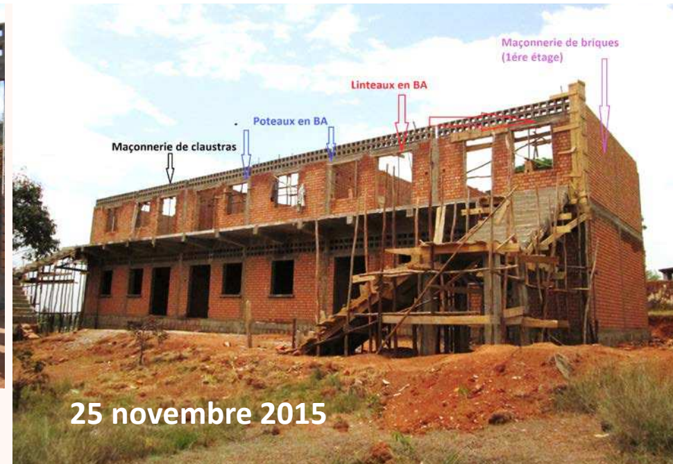
25 novembre 2015