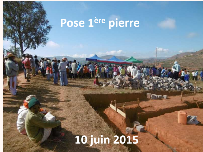
Pose 1 ère pierre