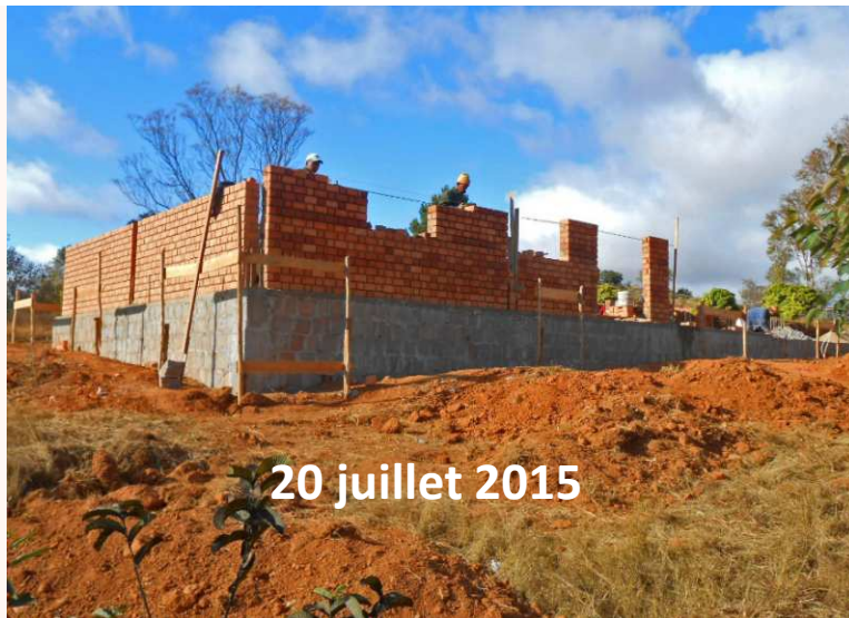
20 juillet 2015